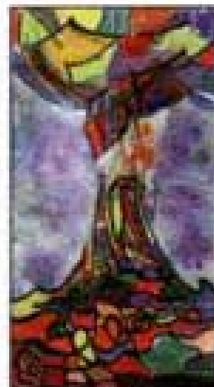
Gravure 24 x 12 cm eau-forte et aquatinte 1979

- Eh bien, le septième art a révolutionné véritablement la façon de vivre autour de la terre. Et ensuite, si vous voulez, ce défi entre une image qui bouge et une peinture statique m'a fascinée. Parce que ma peinture a toujours ce désir de mouvement. Et d'ailleurs elle est très en mouvement, ma peinture. Elle est vraiment - selon comme vous la regardez - elle bouge. Enfin... Et pourquoi je me suis éloignée de l'apparence immédiate? C'est pour que vous-même, vous