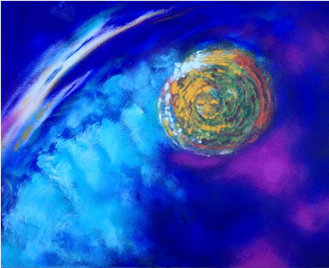
"La Tête d'Or " Acrylique sur toile 73 cm x60 cm

poétique de l'estampe et ses photos cadrent une interprétation originale des espèces environnementales, puis révèlent aussi ce lieu de recueillement qu'est le monument de l'Ile aux Cygnes.