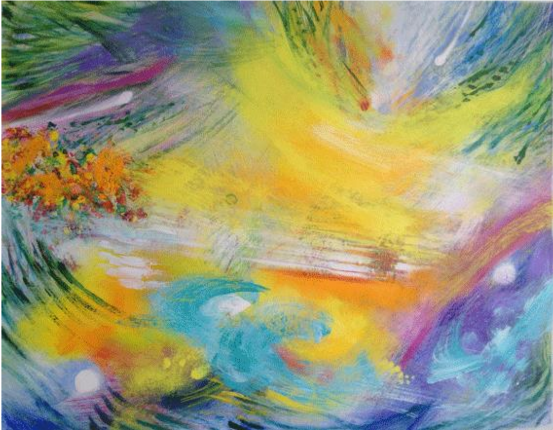
"Contre Vents et Allées" Acrylique et pastel sur papier 51 cm x 41.5 cm

Des couleurs à foison, des formes saisies qui surprennent et orchestrent ses nouvelles peintures, notamment, sur deux versions musicales des Quatre Saisons d'Astor Piazzolla.