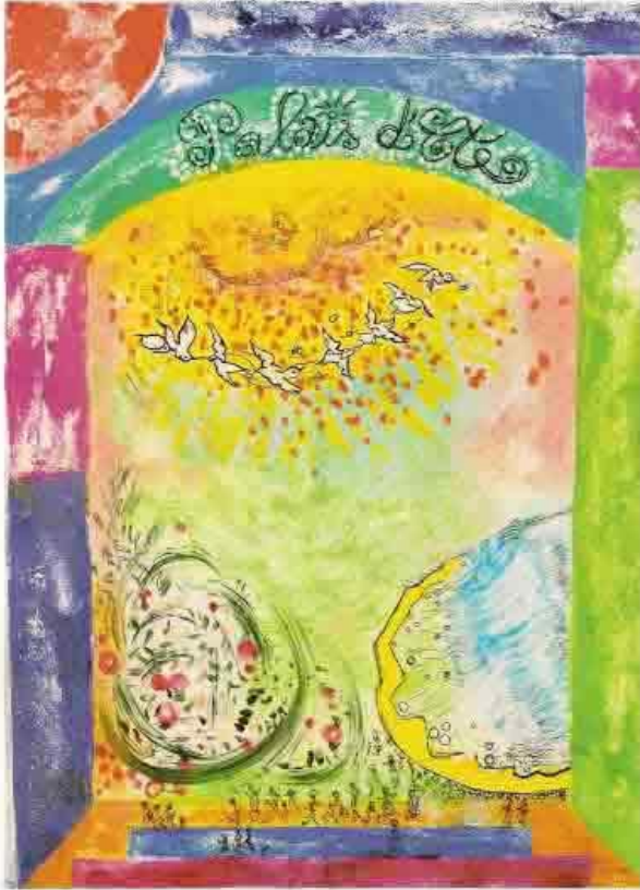
Palais d'été - Acrylique et collage

Couleurs marbrées du Palais d'Été, colonnes provisoires des filles célébrées... La roulement des oiseaux invitent les fumeurs à se rejouir. Aimons les bienfaits de la vie ; le miroir bleu-vert de l'Wang saisit les bulles de notre pensée.